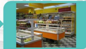
дистрибуция и продажи